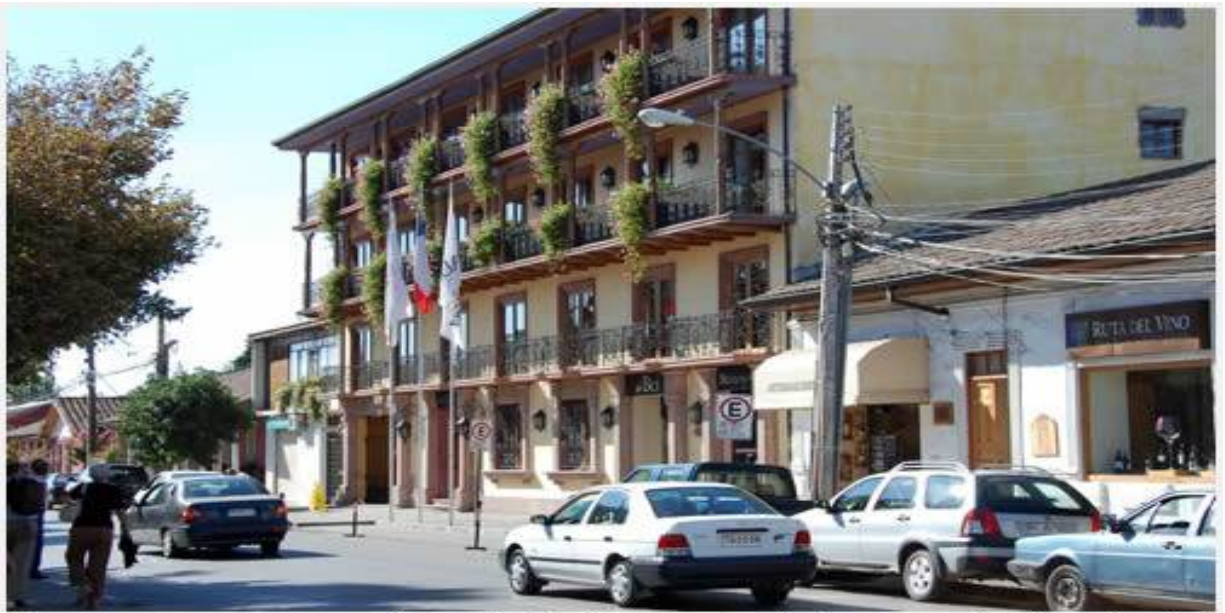
Una vez que empezamos a caminar por la ciudad, nos asombran las buenas construcciones de esta pequeña urbe correspondiente a la región de O'Higgins